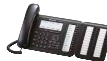
Fotografie: KX-NT556 s KX-NT505