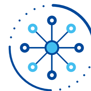
System s více připojeními

KX-NSX je ideální pro jakoukoli společnost využívající škálovatelnosti. Podporuje až 2 000 uživatelů a umožňuje plynulé komunikační připojení až 32 míst se zařízeními řady KX-NS. Zařízení mohou také šetřit náklady, protože hovory mezi kancelářemi s využitím sítě KX-NS budou považovány za interní hovory. Podporováno je sdílení až 128 nájemníků, unified messaging, firemní telefonní seznam a řada dalších funkcí.