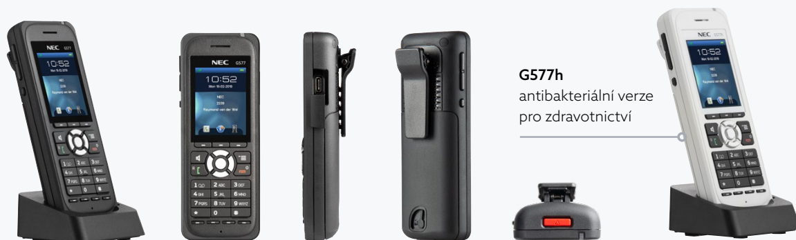
G577h antibakteriální verze pro zdravotnictví